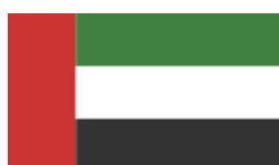
EMIRATS ARABES UNIS